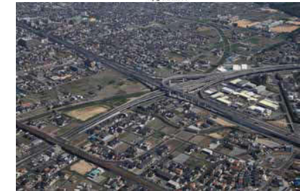
《ものづくりを支える道路網(加古川中央ジャンクション)》