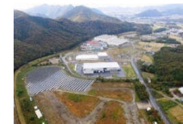
《産業集積・にしわき上比延工場公園》