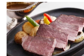
《西脇ローストビーフ》