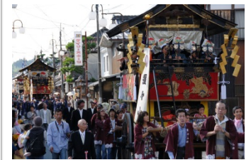
江戸時代のたたずまいが残る篠山城下町