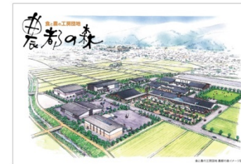
食と農の工房団地イメージ図