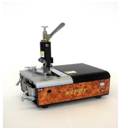
(レザークラフト皮漉機、 NP-S7 スカイミニ)