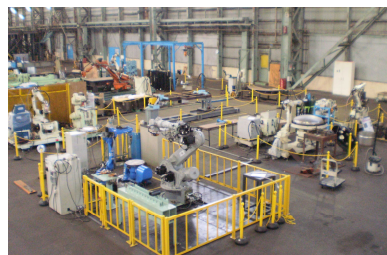
(同社が開設したロボットテクニカルセンター)