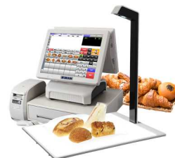
(パン画像識別装置 BakeryScan)