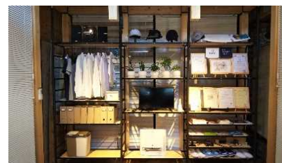
(収納オプションパーツ)