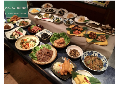
(同社が製造するハラール和惣菜)