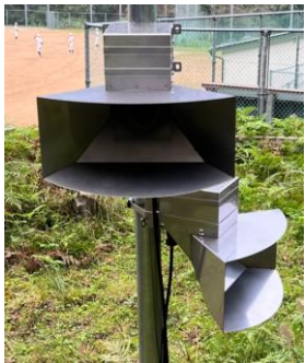
[調達実績] 新温泉町 大手電力会社