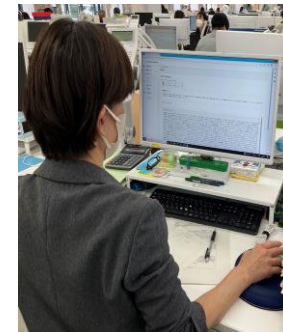
[調達実績] 多可町 兵庫県