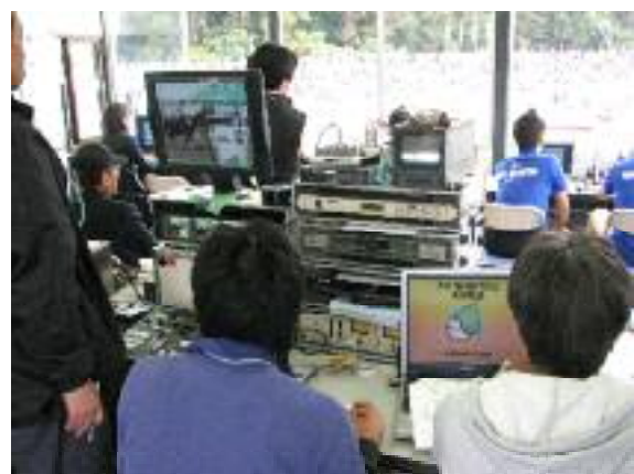
株式会社ファインシステムのスポーツ計測のようす

高丸工業株式会社(尼崎市)【優秀賞】 中小企業の産業用ロボット導入を支援するため、独立した視 点でメーカー各社のロボットから最適なものをコンサルティング