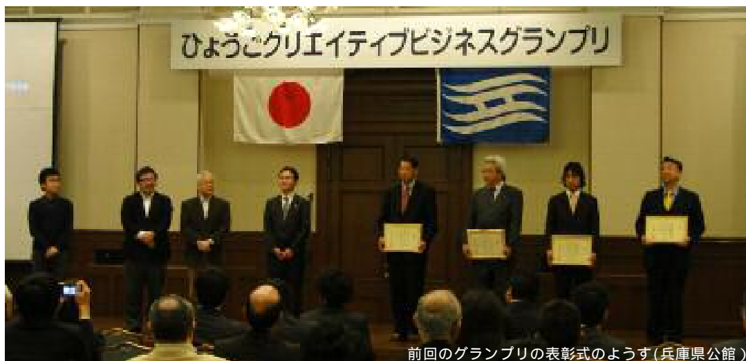
前回のグランプリの表彰式の様子(兵庫県公館)