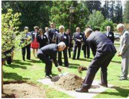
(50周年記念植樹を行う両知事)