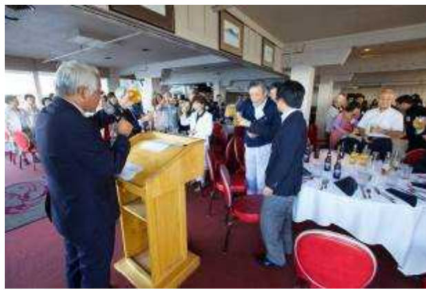
(50周年と友好訪問団に乾杯)