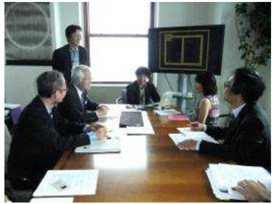
(エンパイアステートビル75階に位置するオフィス) (播州織生地の販売展開について意見交換)