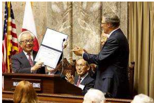
(インズリー知事より名誉州民賞を授与された貝原前知事)