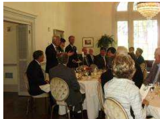
(両知事による始めの乾杯)