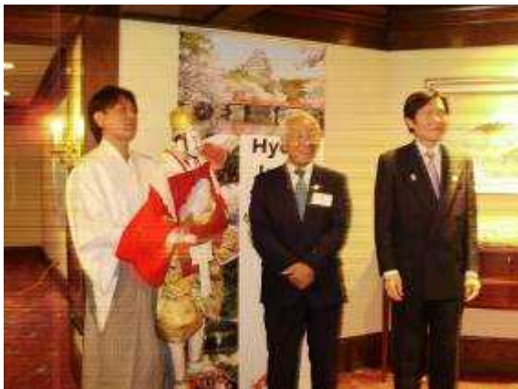
(大村総領事とゲストを迎える知事)

エ 内 容：在シアトル総領事館と兵庫県の共催で実施。地元観光・経済関係者等の参 加を得て、兵庫県の観光PRと神戸ビーフ、日本酒、兵庫米、出石そば、 ソースなどの県産品の試食会等の実施を通してプロモーションを行った。 特に神戸ビーフには長い列が並び、ワシントン州参加者から美味しいとい う感嘆の声があちこちで上がり、PRに成功した。