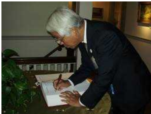
(記名帳にサインをする井戸知事)

エ 内 容：兵庫県側からプロモーションのために送った神戸ビーフにインズリー知事ほかワシントン州側関係者が絶賛の声をあげるなか、なごやかに歓談した。