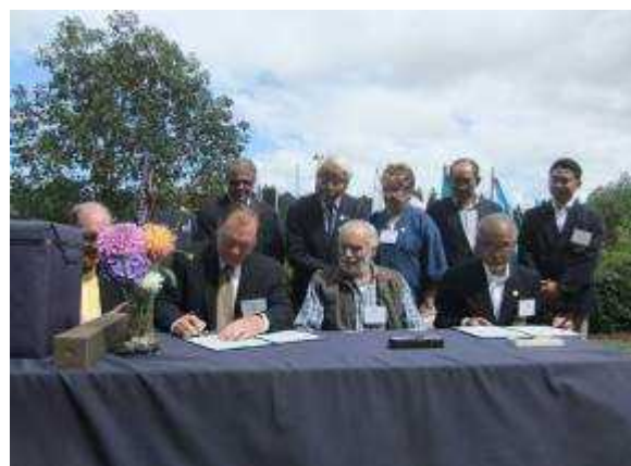
(姉妹マリーナ提携)