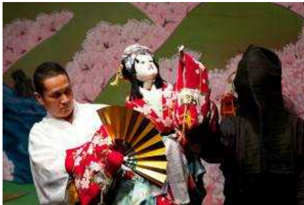
(淡路人形浄瑠璃・義経千本桜の静御前)

シアトル地域の新聞「シアトルタイムズ」は、地域版1面に大きな写真入りで掲載し、17年前に震災支援へのお礼として開催されたシアトル公演も紹介するなど、兵庫県とワシントン州との友好交流50周年を特集した。