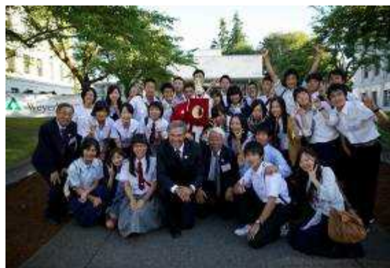
(両知事と兵庫県立高校の生徒)