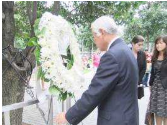
(サバイバルツリーの前で献花する知事)