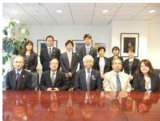
(自治体国際化協会ニューヨーク事務所訪問)