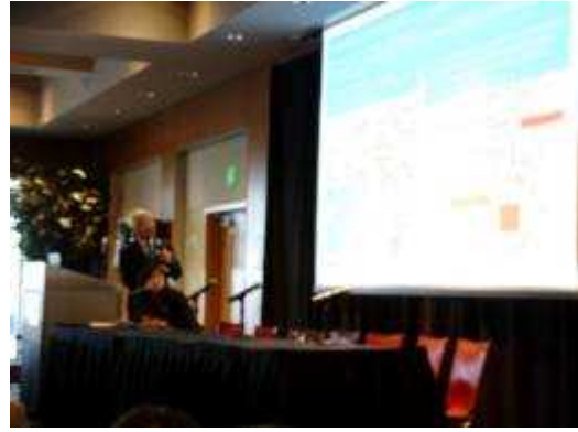
(井戸知事による発表)