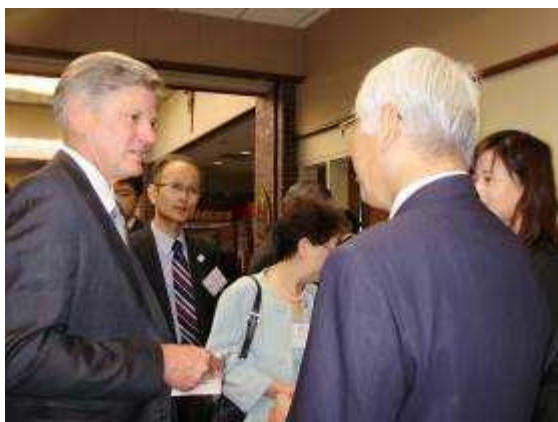
（セントマーチンズ大学学長と）

エ 内 容：「地震への備え、災害救助、社会的均衡の回復—我々はどうやって到達する のか」をテーマに双方の学会から計 11 名が発表した。 また知事から挨拶を兼ねて、阪神淡路大震災後の復興復旧過程の復興テ ーマが、時期により変わっていくこと、南海トラフ大地震対策として、地震 対策、津波対策、避難対策を進めていることを紹介した。