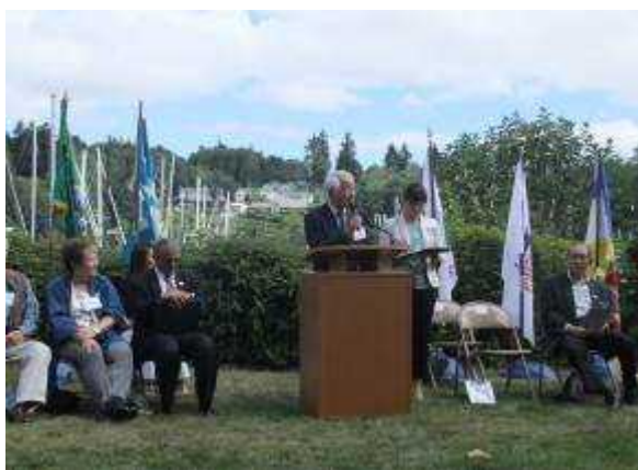
(井戸知事による挨拶)

エ 内容:スワウンタウンマリーナのマックレガーボートコミッショナーと新西宮ヨットハーバーの林社長がマリーナ間の相互交流などを図る姉妹マリーナ提携協定に調印、オーウェン副知事と井戸知事が立ち会った。