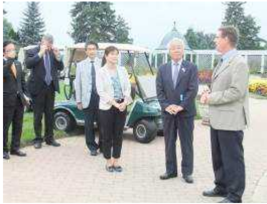
(ナイアガラ園芸学校の庭園を見学)