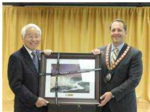
(ナイアガラフォールズ市長と)