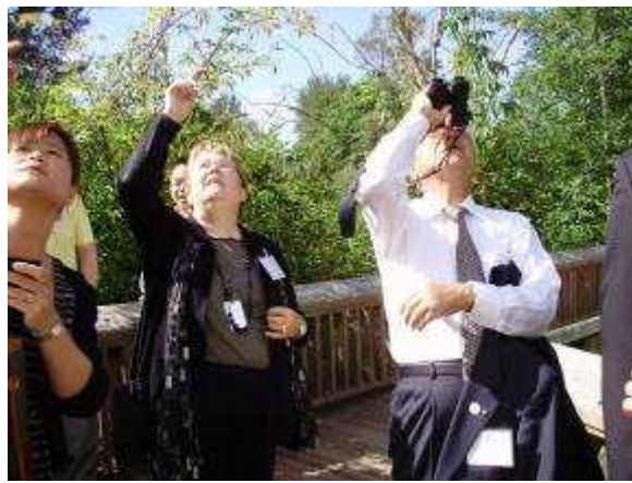
(絶滅危惧種ハヤブサを観察)