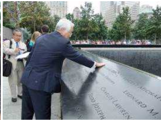
(兵庫県ゆかりの犠牲者の名前の前で)