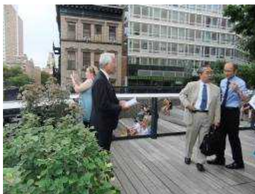
(都会の緑地帯ハイラインを視察)