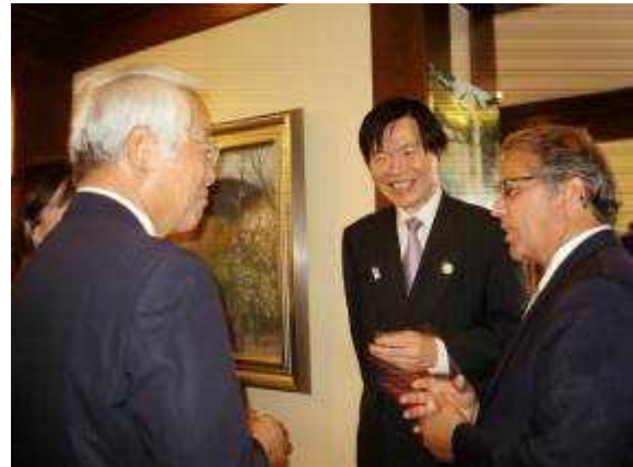
(オーウェン副知事へのトップセールス)