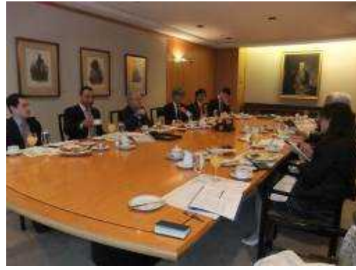
(シティバンク本社の歴史的な展示の説明を受ける) (地方債の仕組み等について意見交換)