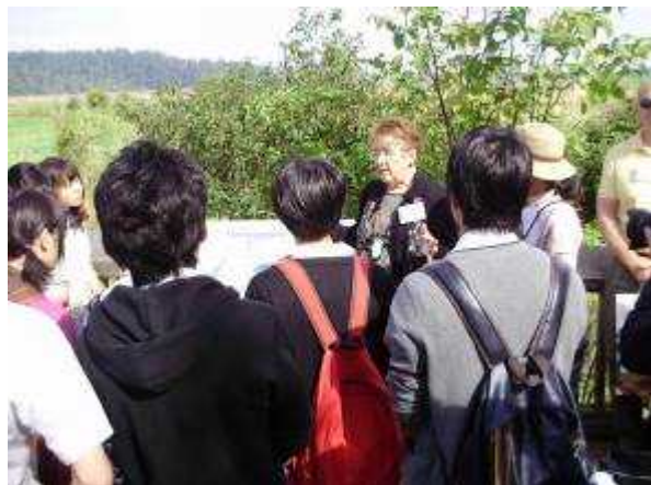
(フレージャー議員による保護区の説明)