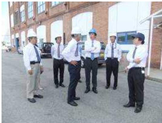
(歴史的なヨンカース工場の建物前で)