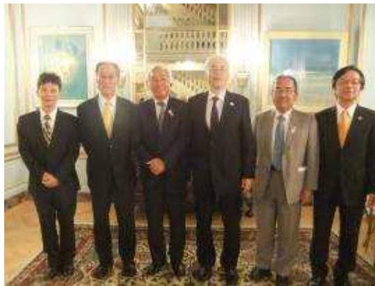
(ニューヨーク総領事（大使）との面談)