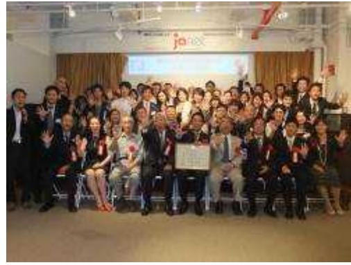
(若手が積極的に盛り上げる県人会)