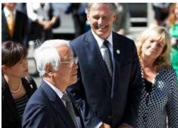
(井戸知事を迎えるインズリー知事夫妻)

また、30周年の記念植樹のアメリカツガの木が大きく育ったのをスペルマン元知事、ローリー元知事と貝原前知事を交えて確認し、その近くに現両知事が50周年を記念してモクレンを植樹した。