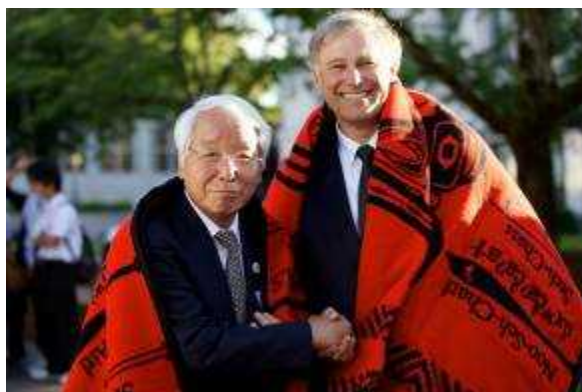
(ネイティブインディアンの贈り物をはおって)

兵庫県側から淡路人形浄瑠璃の戒舞を披露し、ワシントン州側はジャズ演奏を行なうなど、賑やかに兵庫県友好訪問団とワシントン州民、両県州中高生の交流がなされた。