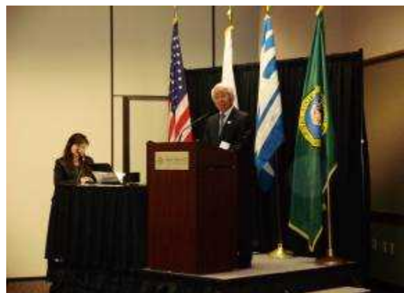
（セミナー 冒頭の知事挨拶）