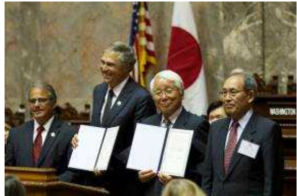
(50周年記念共同声明)