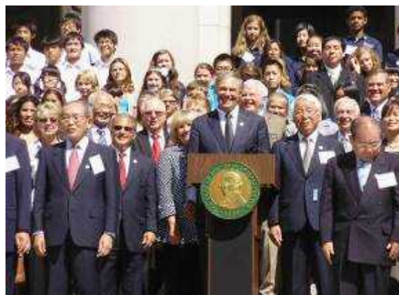
(インズリー知事による歓迎セレモニーアナウンス)