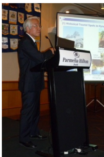
プレゼンテーションする知事

井戸知事は、パース企業を中心としたパース・ロータリークラブにおいて、約 80 名参加のもと、ひょうごセミナーを開催した。最初に、同クラブ会長のクジンスキー会長から、兵庫県とパースとの経済交流促進に対する期待する旨の挨拶があり、続いて、井戸知事より、「西オーストラリア州と兵庫県の交流は教育、文化、経済、芸術など幅広いものになっている。また、東日本大震災への同州からの支援に感謝する。5 か月を経過しようとしているがようやく復旧・復興の道筋がついた。日本は危険な場所ではない。」と挨拶。引き続き、本県の概要、本県と西オーストラリア州との交流、本県の企業立地、観光の魅力について、パワーポイントによるプレゼンテーションを行った。