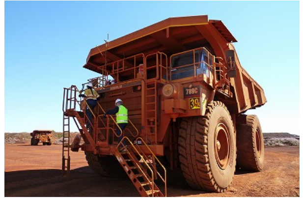
大型トラックに知事乗車