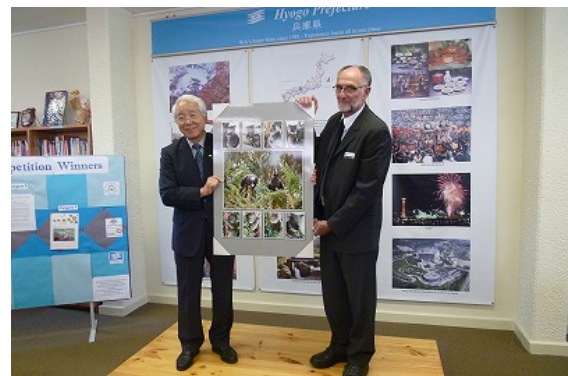
ウイラー氏からパネルの贈呈