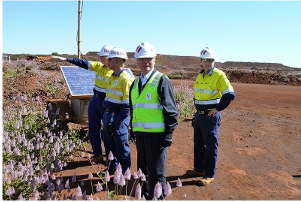
鉄鉱石採掘現場を視察する知事