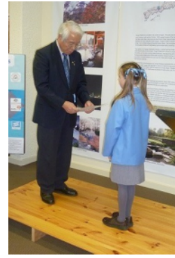
エッセイコンテスト受賞式