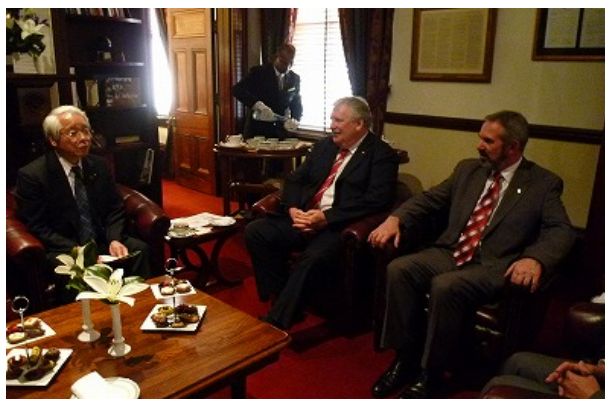
ハウス上院議長（中央）を表敬訪問

前日、兵庫県議会訪問団と交流を行っており、議長は、今後さらに兵庫県議会との交流を進め、両県州の交流を促進したい旨の表明をされた。