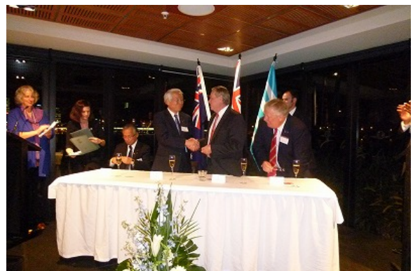
共同声明に調印する知事、首相、県議会議長、上院議長