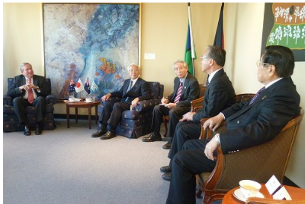
バーネット首相と姉妹交流の推進について協議