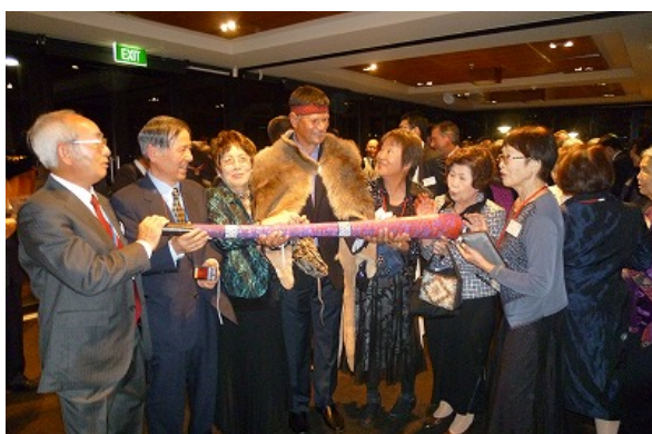
交流を深める両県州民