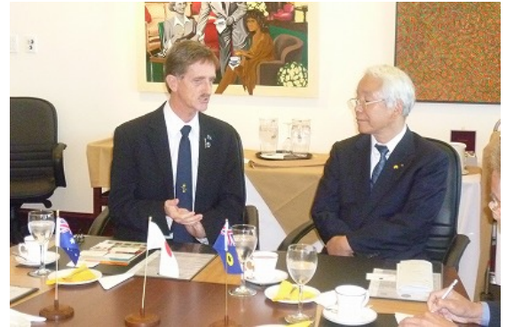
ウッドアムス下院議長を表敬訪問

前日、兵庫県議会訪問団と交流を行っており、今後さらに兵庫県議会との交流を進め、両県州の交流を促進したい旨の表明をされた。