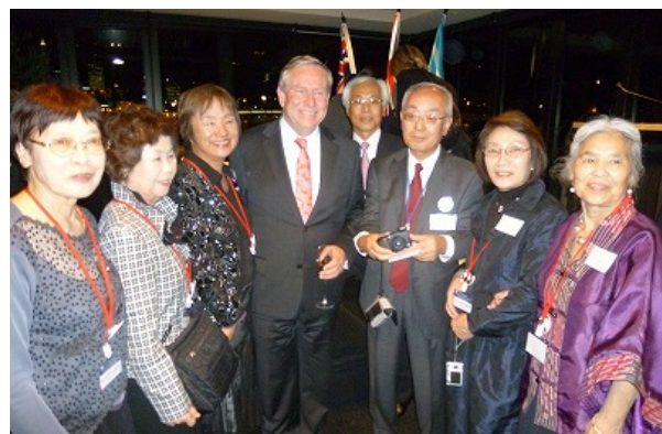
バーネット首相と記念撮影する県民交流団