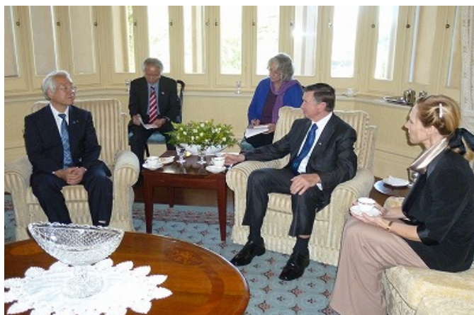
マクカスカ州総督を表敬訪問