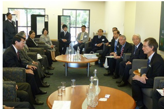
ギル名誉学長との面談