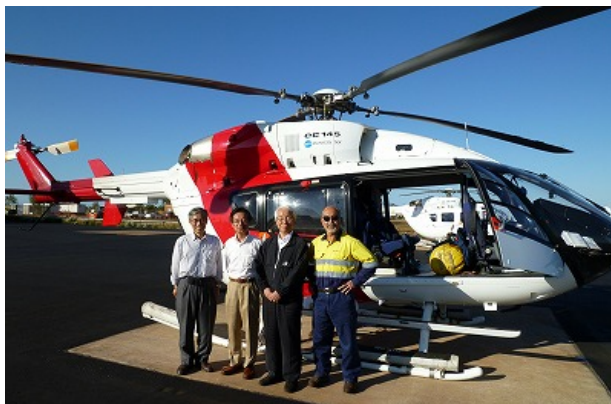
視察用ヘリコプター