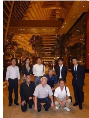
マリーナ・ベイ・サンズで県人会 メンバーと記念写真

シンガポールでのトランジットの時間に、シンガ ポール兵庫県人会（兵星会）幹部との懇談を行った。