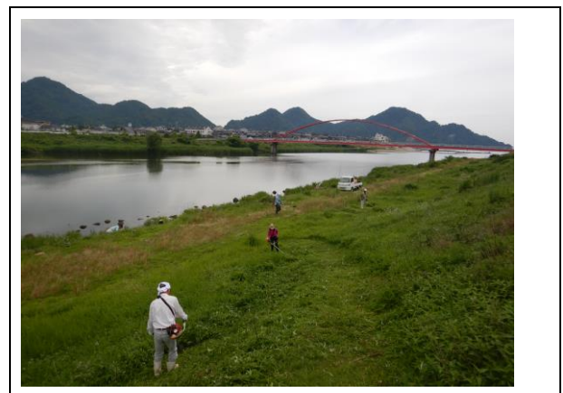
30年6月23日 岸田川河口