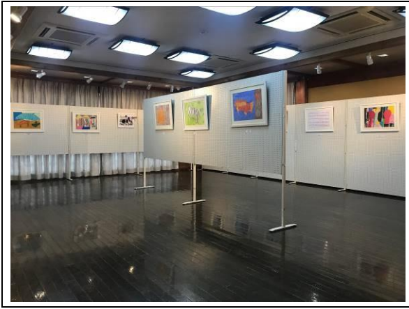
H30年5月5日美術クラブ展