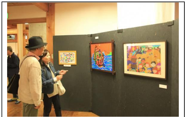
H30年10月23日森の美術館展