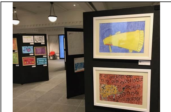
H30年9月30日第9回がっせえアート展