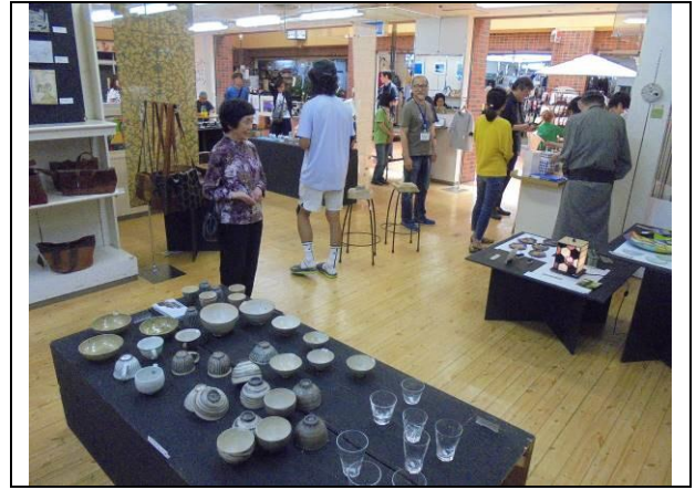
H30年6月3日応援チャリティー展