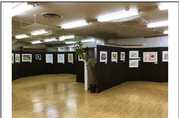
H30年11月5日美術クラブ展