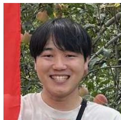
まさかずさん インフルエンサー (山陰北近畿魅力発信)