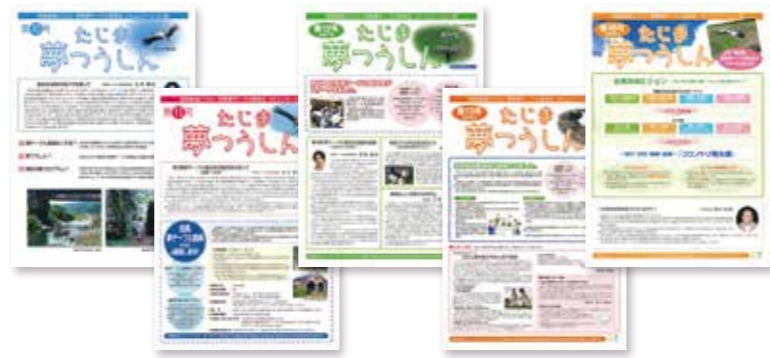
「たじま夢つうしん」表紙(10号～)