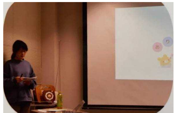
R2年11月16日 実践者の成果発表