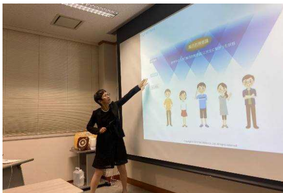
R2年11月16日 講師による講座