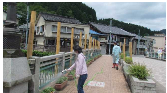
2年5月22日 プランター設置