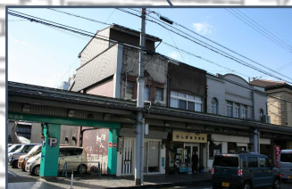
④旧5軒長屋 当初は5軒あったRC造2階建の3軒長屋。除却された2軒のRC造の柱や梁が今でも残る。