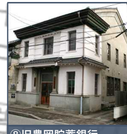
⑧旧豊岡貯蓄銀行 和洋折衷の装飾的な特徴を持ち、軒裏は漆喰塗りや銅板張り、隣家との間には袖うだつを設けた木造防火建築。