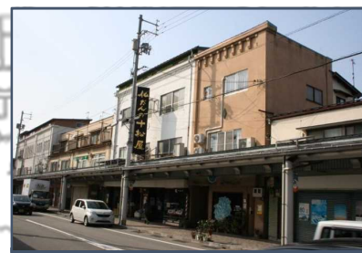
⑦河見家住宅 RC造3階建の店舗併用の長屋住宅で、当初の陸屋根の外観が残る。