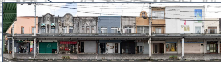
⑤大開通南側長屋 復興期に建築された最も大きな長屋で、大開通りに面する部分をRC造とすることで、都市の防火帯として機能している。また、一部に残るモルタル塗りの外観は建設当初の面影と時代の経過を感じさせる景観となっている。