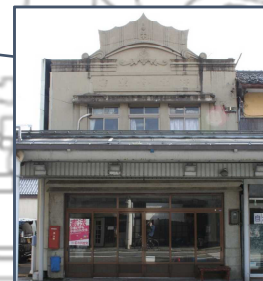
⑥鈴木家住宅 大開通り南側で唯一の戸建RC造。王冠装飾が特徴的。