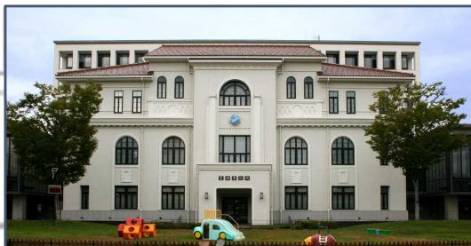
①旧豊岡町役場庁舎（国登録有形文化財） 昭和2年度にRC造2階建の豊岡町役場として建設され、その後3階部分の増築、平成23年度に保存活動により曳家で移動。現在は議場・交流センターとして活用され、震災復興のシンボルとして親しまれている。

豊岡中心部では北但大震災（1925年（大正14年））からの復興期に建築された鉄筋コンクリート造（RC造）建築物や木造防火建築物の多くがまちなみとして残っており、北但大震災の2年前に発災した関東大震災後の復興遺産の多くが消失したことを踏まえると、希少性が高く、震災からの復興を今でもよく伝える重要な遺産である。