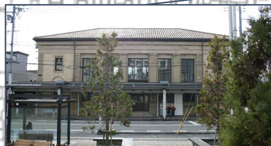
②旧兵庫縣農工銀行豊岡支店（国登録有形文化財） 昭和9年にRC造2階建の銀行として建築され、意匠的に優れた復興建築。現在はホテルとして運営。