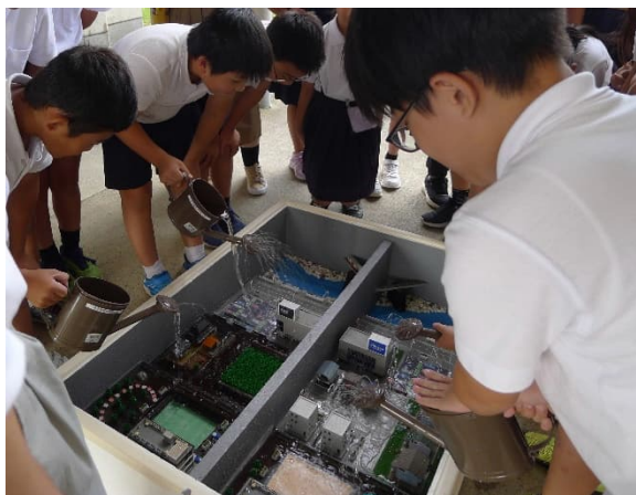
総合治水模型実験