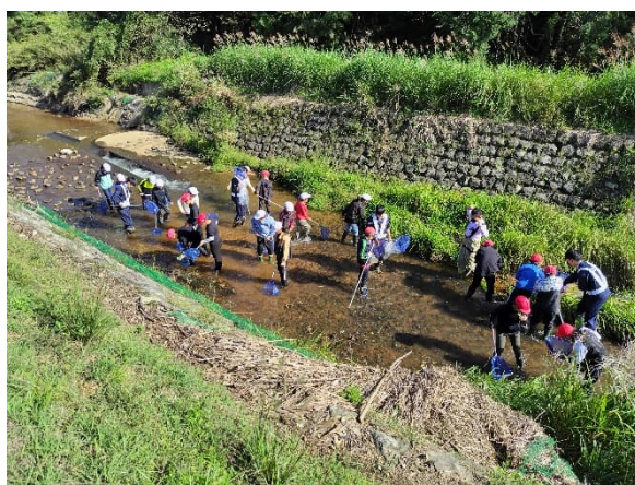
現場見学(生物調査)