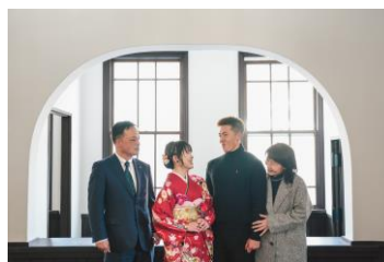
昨年度の撮影会の様子