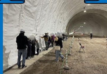
新諸寄第2トンネル