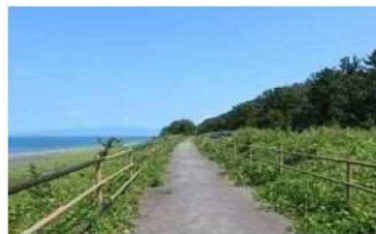
<太平洋岸自転車道>

太平洋岸自転車道等を対象として、先進的なサイクリング環境の整備を目指すモデルルートを設定し、関係者等で構成される協議会において、迷わず安全に走行できる環境整備、自転車のメンテナンスサービスの提供等サイクリストの受入環境整備、ガイドツアーの質の向上等滞在コンテンツの磨き上げ等による魅力づくり、ICTを活用した情報発信を行う等、官民が連携して世界に誇るサイクリングロードの整備を図る。