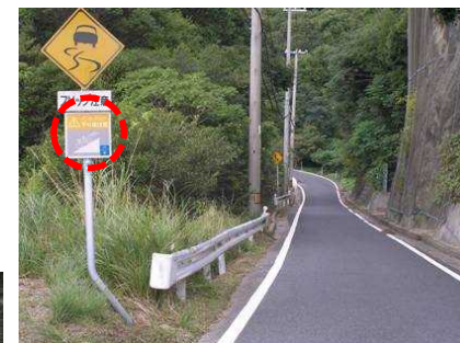
注意喚起標識 コース情報標識