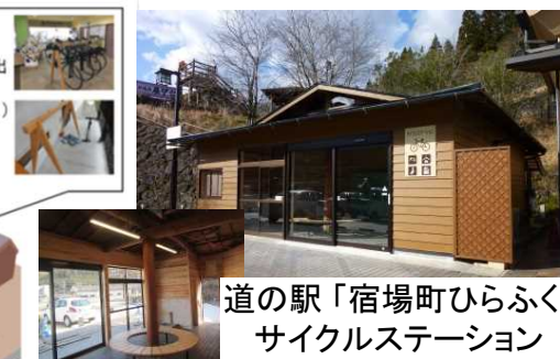
道の駅「宿場町ひらふく」サイクルステーション