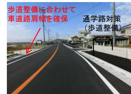
道路事業に合わせた路肩整備