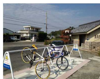
サイクルスタンド設置