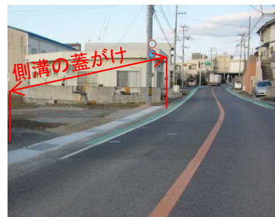
狭隘区間での路肩幅確保