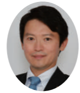
特別顧問 齋藤元彦 兵庫県知事