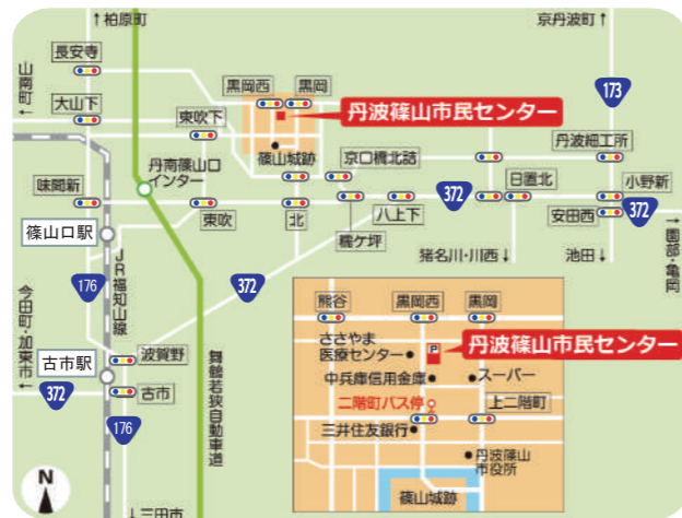
丹波篠山市民センター