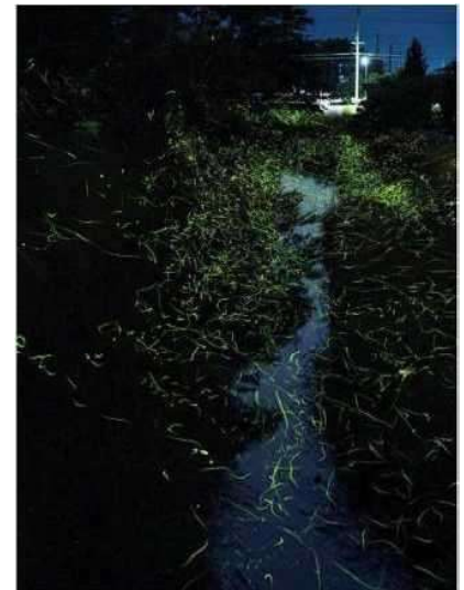
地区内を飛遊するホタル