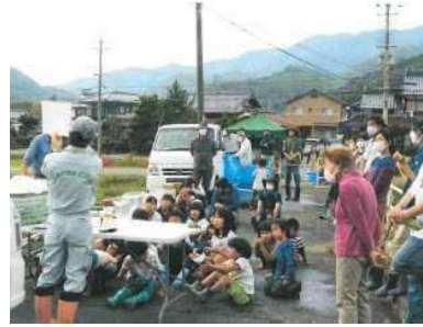
ため池の生きもの観察