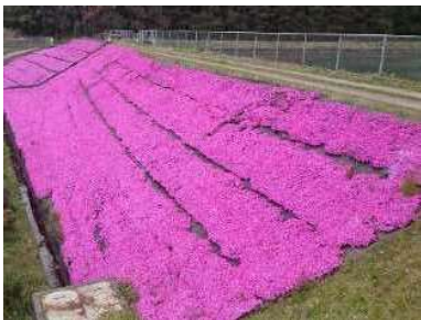
ため池の堤体へシバザクラの植栽