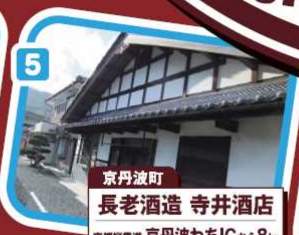
京丹波町 長老酒造 寺井酒店 京都縦貫道 京丹波わちICから8km