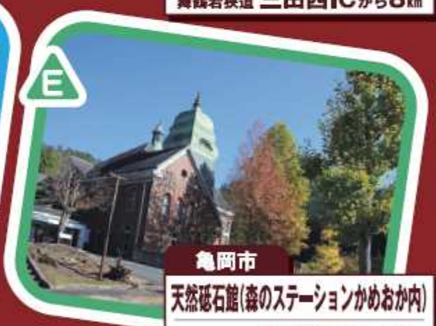
亀岡市 天然砥石館(森のステーションかめおか内) 京都縦貫道 千代川ICから3km