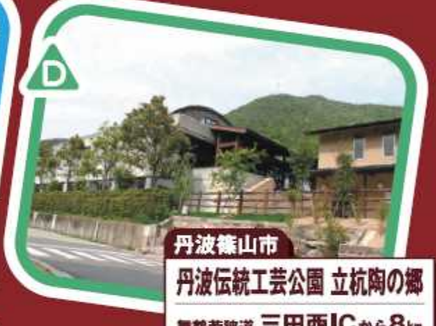
丹波篠山市 丹波伝統工芸公園 立杭陶の郷 舞鶴若狭道 三田西ICから8km