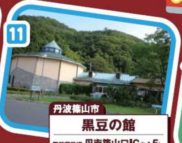
丹波篠山市 黒豆の館 舞鶴若狭道 丹南篠山ICから5km