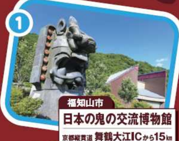
福知山市 日本の鬼の交流博物館 京都縦貫道 舞鶴大江ICから15km