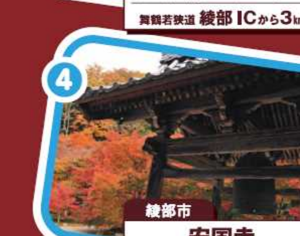
綾部市 安国寺 京都縦貫道 綾部安国寺ICから1km