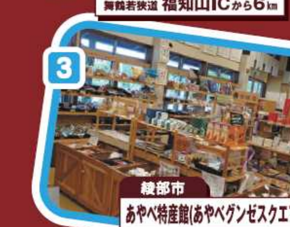
綾部市 あやべ特産館(あやべゲンゼスクエア) 舞鶴若狭道 綾部ICから3km