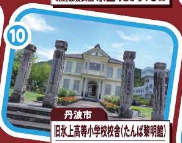
丹波市 旧氷上高等小学校校舎(たんば黎明館) 北近畿豊岡道 氷上ICから6km