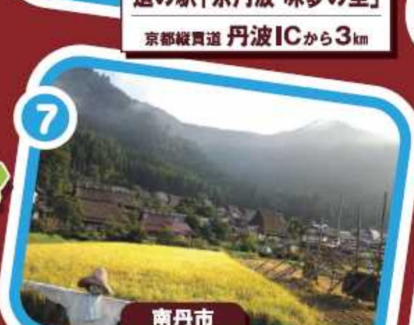
南丹市 かぶきの里 北集落 京都縦貫道 園部ICから33km