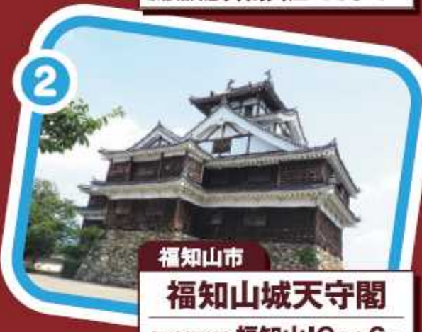
福知山市 福知山城天守閣 舞鶴若狭道 福知山ICから6km