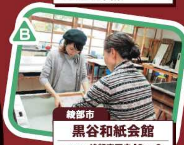
綾部市 黒谷和紙会館 京都縦貫道 綾部安国寺ICから6km