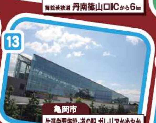
亀岡市 生涯学習施設・道の駅 ガレリアかめおか 京都縦貫道 亀岡ICから2km