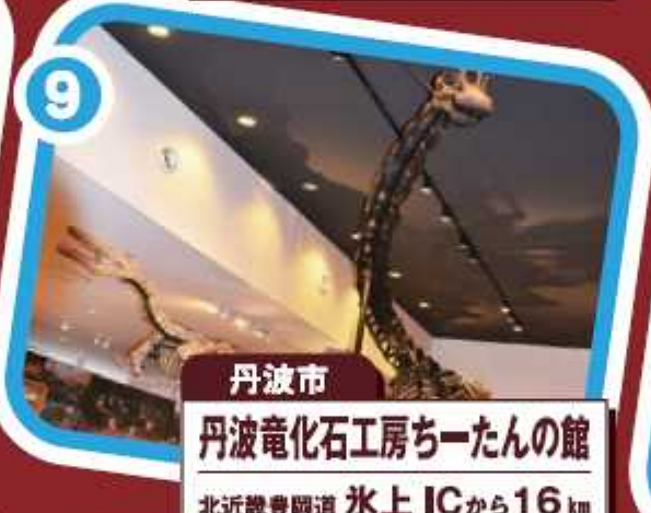
丹波市 丹波電化石工房ちーたんの館 北近畿豊岡道 氷上ICから16km