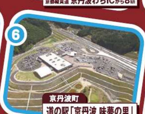
京丹波町 道の駅「京丹波 味夢の里」 京都縦貫道 丹波ICから3km