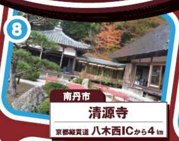
南丹市 清源寺 京都縦貫道 八木西ICから4km