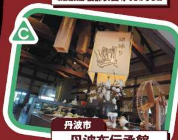
丹波市 丹波布伝承館 北近畿豊岡道 青垣ICから1km