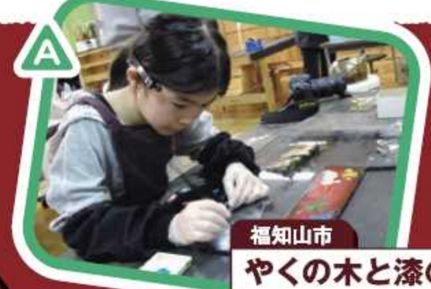
福知山市 やくの木と漆の館 北近畿豊岡道 山東ICから5km