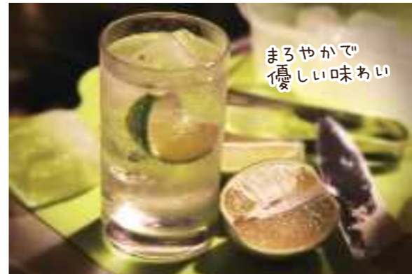
まろやかで優しい味わい