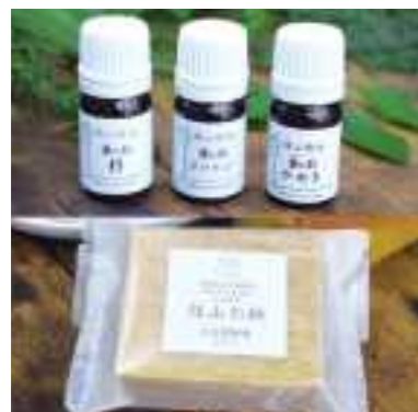
平成30年度 株式会社ささやまビーファーム(丹波篠山市) 篠山石鹸・篠山精油