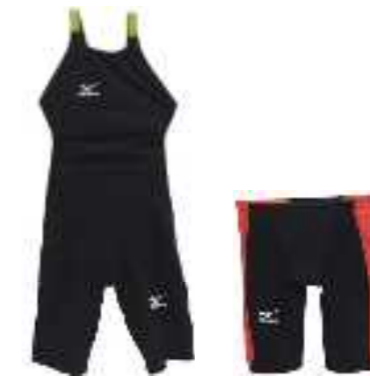
平成27年度 ミスノテクニクス株式会社 水上工場(丹波市) 無縫製技術による高速水着 「GX-SONIC II」