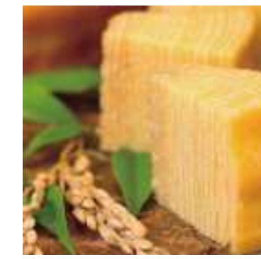
平成30年度 株式会社まさゆめさかゆめ(丹波市) 夢ばあむ