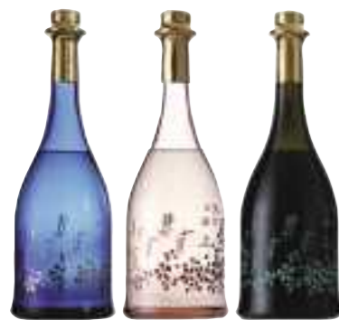
平成26年度 株式会社西山酒造場(丹波市) 通年楽しめるしぼりたての純米大吟醸酒「小鼓 路上有花シリーズ」