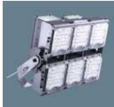
平成29年度 パナソニックライティングシステムズ株式会社 春日工場 (丹波市) LED投光器モジュールタイプ