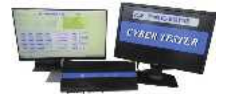
平成27年度 株式会社岩崎電機製作所(丹波篠山市) 産業機器等の自動検査装置 「サイバースター」