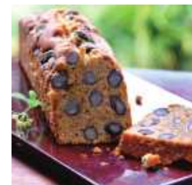
平成28年度 合同会社とあっせ(sasarai)(丹波篠山市) パティスリーバトン