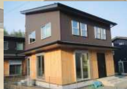
▼SETTE工法で建てた住宅の外観