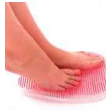
平成28年度 株式会社サンバック市島工場(丹波市) フットグルーマー