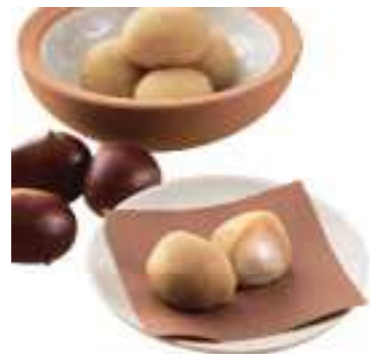
平成27年度 株式会社諏訪園(丹波篠山市) 丹波栗の風味・色合いを生かした「新栗もち」