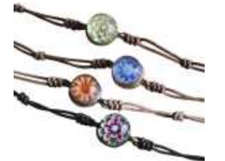
平成27年度 有限会社喜南鈴硝子(丹波篠山市) 特許取得したガラスによるガラス工芸品 「花しずくシリーズ」