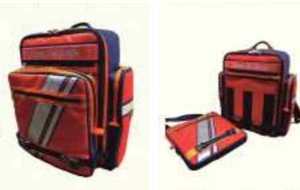
それぞれの現場に応じた 使いやすいバッグを オーダーメイド