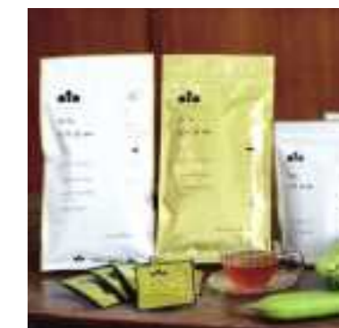
平成29年度 有限会社こやま園(丹波市) 丹波なた豆茶