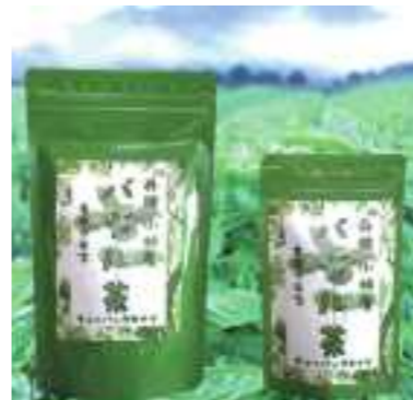
平成28年度 丹波小林屋(丹波市) バジル茶