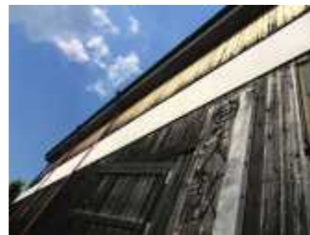
1849年から受け継がれてきた酒造り