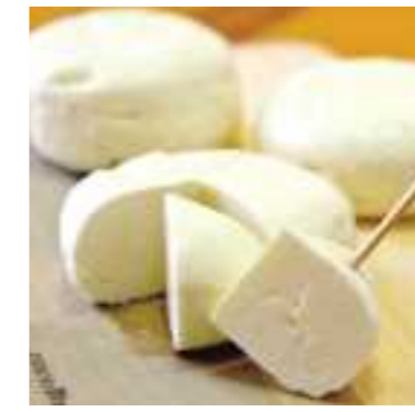
平成29年度 丹波婦木農場チーズ工房(丹波市) ナチュラルチーズサンマルセラン