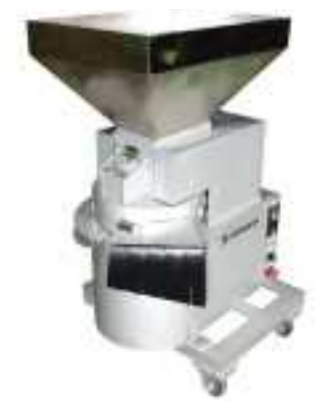
平成28年度 株式会社田村機械製作所(丹波市) ※ 栗の鬼皮剥き機 ※平成29年で廃業。現在は株式会社東洋風圧で取り扱い