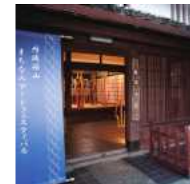
平成30年度 丹波篠山・まちなみアートフェスティバル実行委員会(丹波篠山市) 丹波篠山まちなみアートフェスティバル