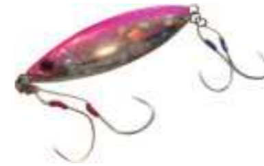
平成26年度 株式会社ささめ針(丹波市) ゆりかごのような動きで沈むジグ 「クレイドル」