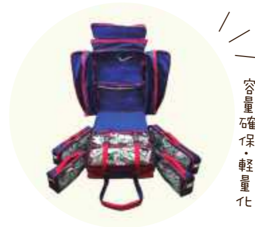
容量確保・軽量化