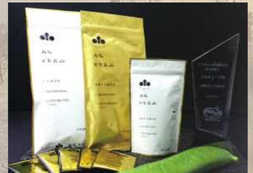
▲国内外で高く評価されている「丹波なた豆茶」

さが30センチ以上にもなる豆で、腎機能の改善やアレルギー症状の緩和などの効果があるとされる「なた豆」を使った丹波なた豆茶。大学との共同研究により健康効果が確認されたオリジナルの種子のみを使い、地元の47のグループ農家と共に無農薬・有機栽培し、お茶に加工しています。国内はもとより、こやま園が現地法人を設立したベトナムをはじめ、海外でも風味