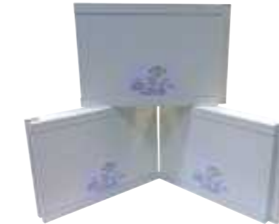
平成26年度 谷水加工板工業株式会社(丹波市) 高い防音性と耐火性を備えた船舶用建材 「船舶用『おとのん』」