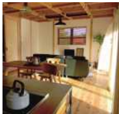
平成29年度 株式会社おいたて工務店(丹波篠山市) SETTE (企画住宅)