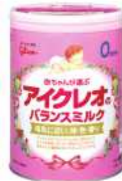
平成28年度 アイクレオ株式会社柏原工場(丹波市) アイクレオのバランスミルク