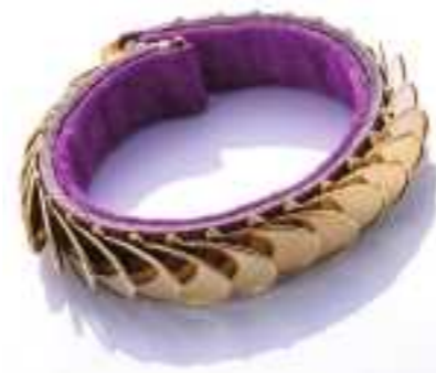
平成28年度 株式会社青山産業研究所(丹波篠山市) こはぜプレスレット