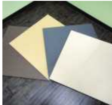
平成30年度 株式会社横谷 (丹波市) フロアtatami