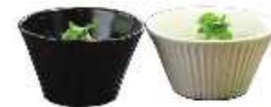
平成27年度 Tanba Style(丹波篠山市) 丹波焼の伝統を生かした洋食の器 「TS Black」「TS White」