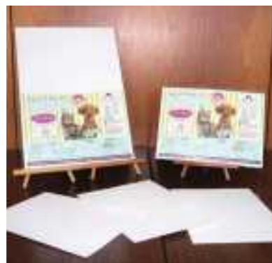
平成30年度 フォト・プランニング(丹波市) クリーンライフプロ