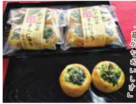
外はパリッと中はフワッと 「意外なおいしさ」