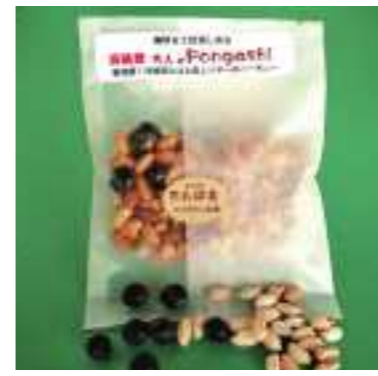
平成29年度 たんばJUNちゃん農園(丹波市) 丹波発大人のPongashi