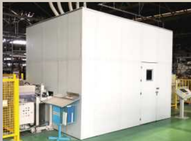
▲騒音を発する工場内の設備を「おとのん」でカバー。「おとのん」の用途は広い。

谷水加工板工業は平成20年に組立式の木製防音室を開発・販売。その延長線上で6年前に開発した「おとのん」は船舶室内用の防音パネルで、国際基準に適合した船舶建造用部材として国内で初めて認証されました。造船業界での採用は順調で、同業界に貢献しています。同社では、「おとのん」の開発にあたって薄い板状の鋼板を加工する設備を導入し、毎年、設備の増強を図