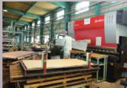
▼薄板鋼板の両端を曲げる工程

てきました。それまでは木質系のパネルの製造に注力してきた同社ですが、「おとのん」で使われる薄板鋼板のパネルが災害用の応急仮設住宅でも応用されることとなり、新たな展開につながりました。仮設事務所などとしても使えるユニットハウスを生産しているメーカーに薄板鋼板の断熱用パネルを納入しており、同社の主力製品のひとつになっています。