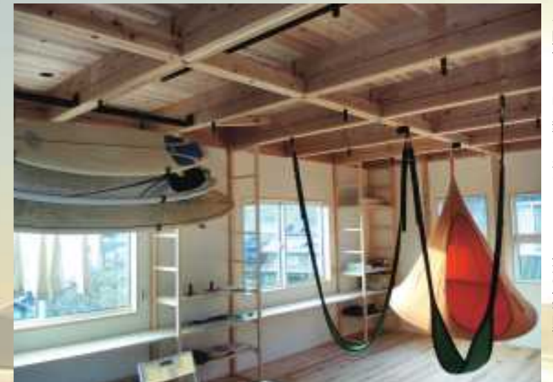
▲間取りを自由に換えられるSETTE工法の住宅内部

本社所在地 兵庫県丹波篠山市味間南 840-8 事業内容 木造建築工事業、住宅新築・リフォーム工事ほか