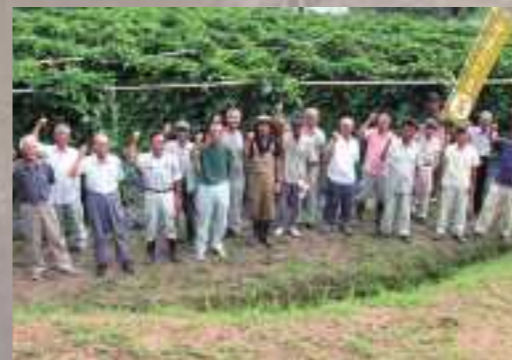
▼なた豆を栽培している農家の皆さん