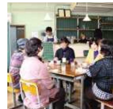
平成29年度 合同会社里山工房くもべ(丹波篠山市) 旧雲部小学校舎を活用した地域づくり