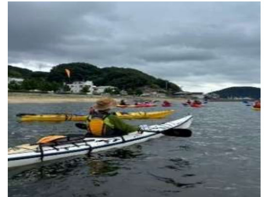
【坂越湾カヤック体験（赤穂市）】