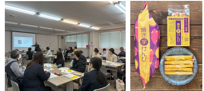
【農福連携加工品開発会議（研修会の様子）と開発商品の「焼き芋けんぴ」】