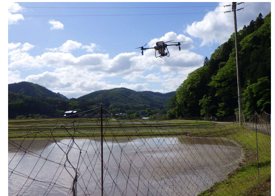
【ドローンによる水稻直播作業 （佐用町）】