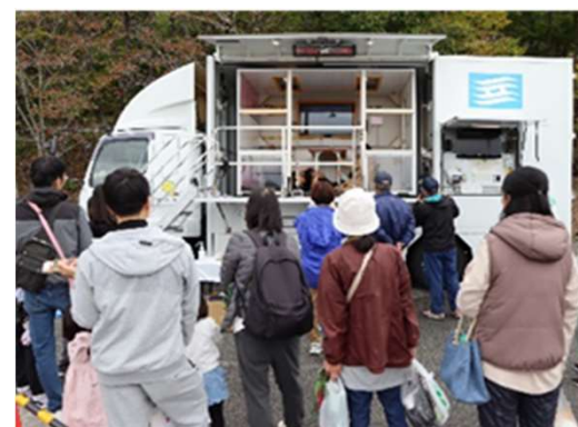
【起震車による地震体験 （フロンティア祭2025）】