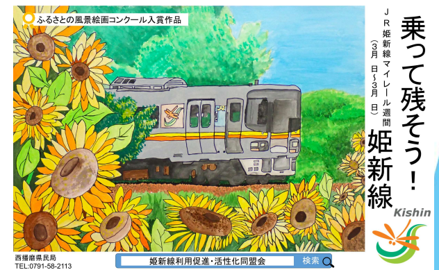
【マイレール期間の取組例（車内中張り広告）】