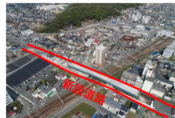
【⑦太子御津線 (茶ノ木踏切)】