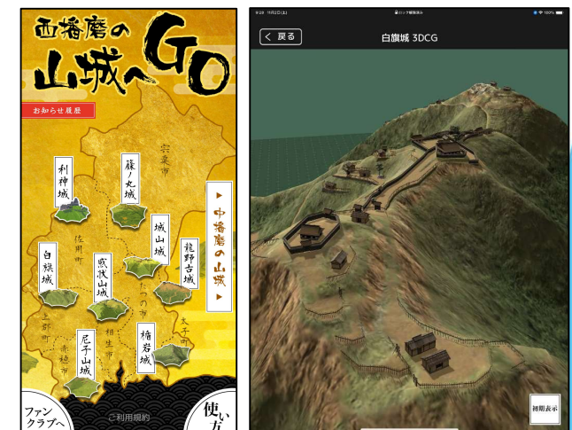
【ARアプリ「西播磨の山城へGO」】