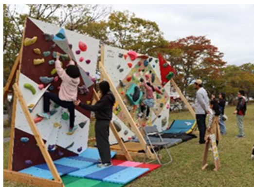
【クライミング体験 （フロンティア祭2025）】