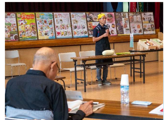
【過去のコンテストの審査会の様子】