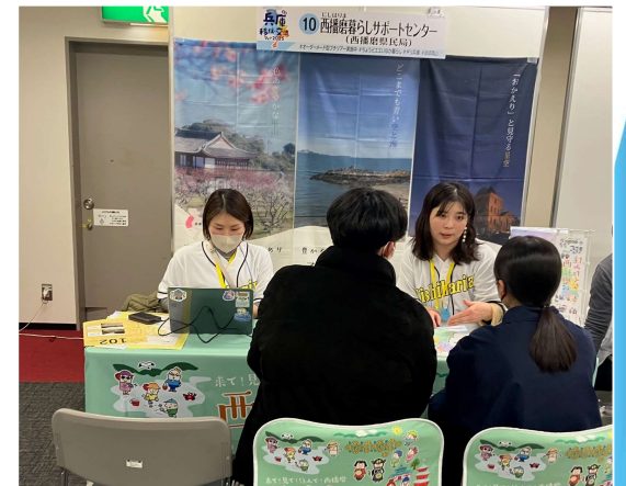
【移住フェアでの相談対応】