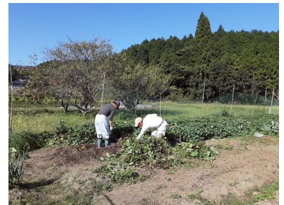
【オーダーメイド型プチツアーでの農業体験】