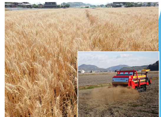
【ASK(発酵諸味粕堆肥)を利用して栽培される小麦（たつの市）】