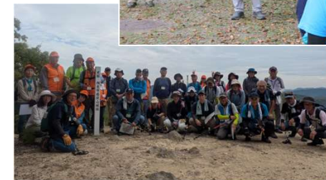
【山城ガイド養成講座 感状山城（相生市）】