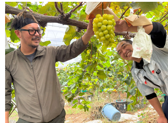
【農業体験研修（宍粟市）】