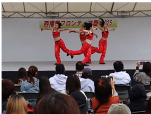
【ダンスコンテスト （フロンティア祭2025）】