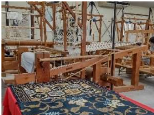
【県指定伝統工芸「赤穂緞通」を体験しよう（赤穂市）】