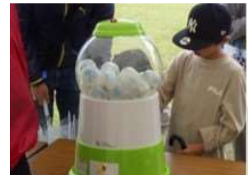
【エコフェス（ミライ地球ガチャ）】

西播磨フロンティア祭において、エコをテーマに、ガチャから出てきた未来の地球の課題に対して適応策を回答する「ミライ地球ガチャ」や、参加型エコクイズ、エコパフォーマンスショー、木工工作、フードドライブ等を実施