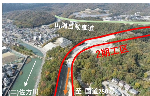
【①竜泉那波線 (2期工区)】