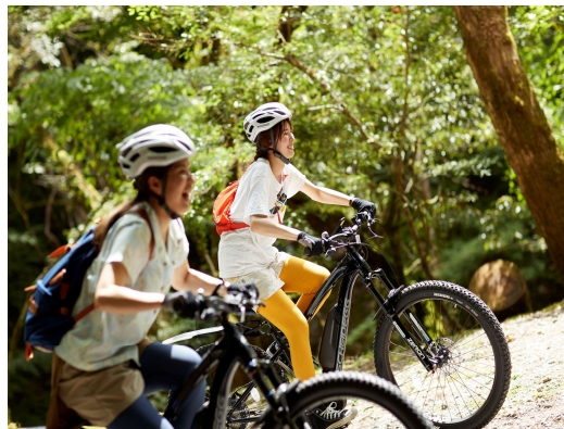
【セラピーバイク（宍粟市）】