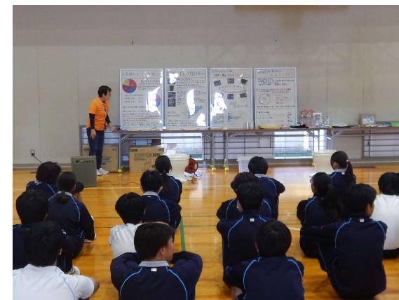
【防災教育出前講座（龍野高校）】