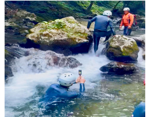
【シャワークライミング（宍粟市）】