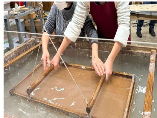
【手漉き和紙 紙漉き体験（佐用町）】