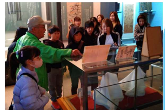
【見学風景（たたらの里学習館・宍粟市）】