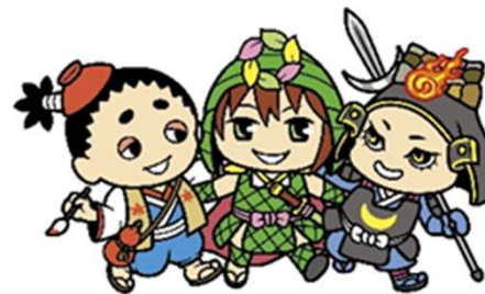
【西播磨の山城3兄弟】