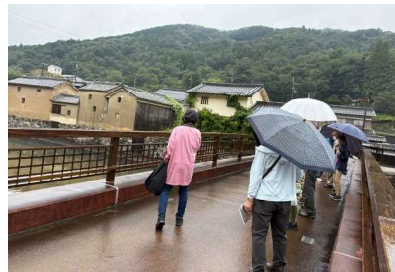
【佐用町 栗拾いツアーの様子】