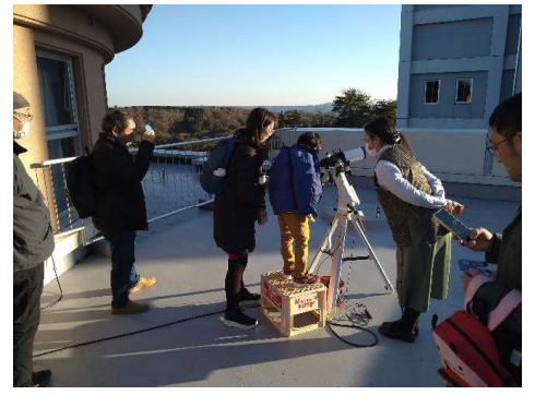
【フィールドパビリオン体験ツアーの様子（西はりま天文台）】