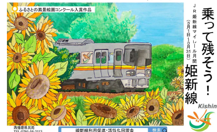
【マイルール月間（中吊り広告）】1