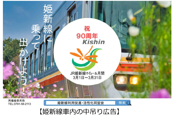
【姫新線車内の中吊り広告】