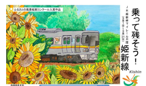
【中吊り掲出画像イメージ】