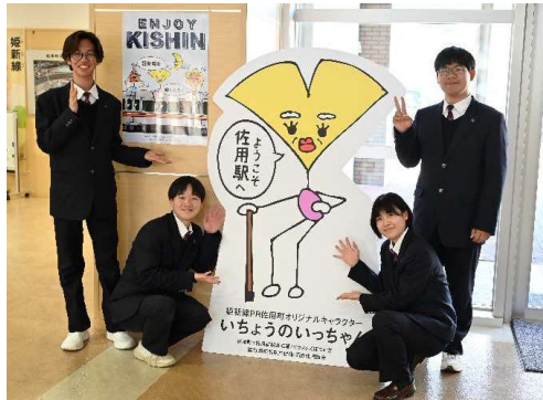
【佐用高校生が作成した利用促進パネル・ポスター】