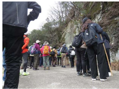
【たつの市 屏風岩・鶴嘴山里公園ハイキング】