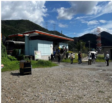
【千本駅駐車場整備（予定）】