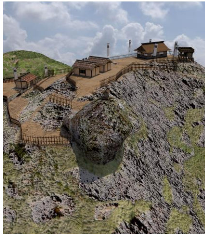
尼子山城想像復元 3DCG