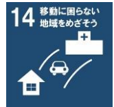
【西播磨地域ビジョン2050取組目標】