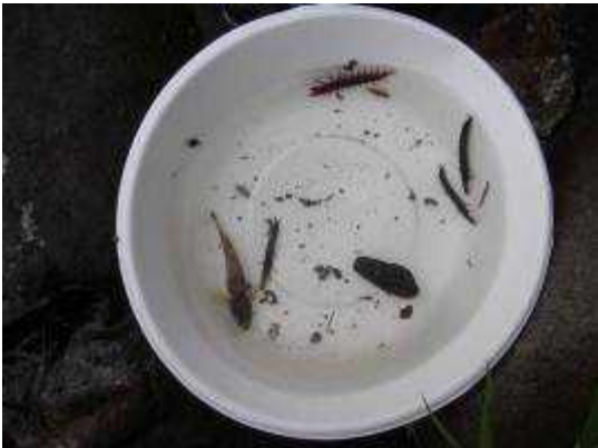
← 採集した水生生物