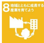
西播磨地域ビジョン 2050 取組目標