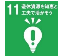
【西播磨地域ビジョン 2050 取組目標】