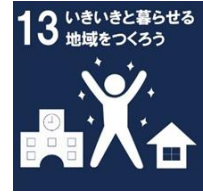
西播磨地域ビジョン 2050 取組目標