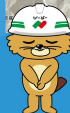
西松建設マスコット キャラクター 西松ビーバー

3月よりダムの天端道路を通行止めさせていただきます。通行止め期間につきましては、ダムの上流側より迂回して通行していただく事になります。皆様には大変ご迷惑をおかけしますがご理解・ご協力をよろしくお願い致します。