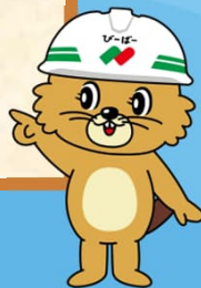
西松建設マスコット キャラクター 西松ビーバー