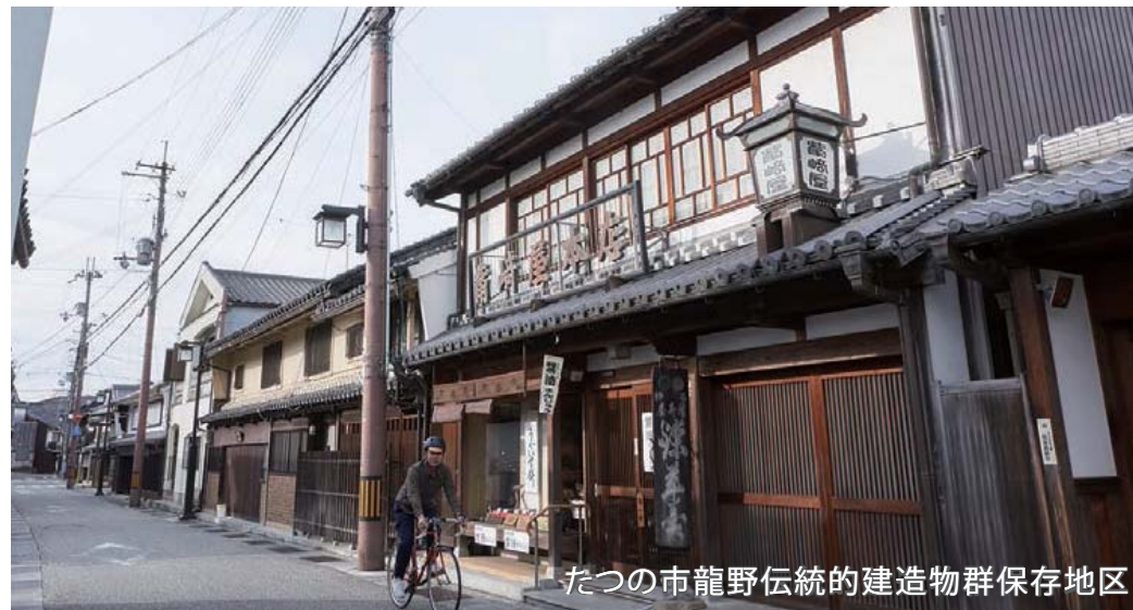
たつの市龍野伝統的建造物群保存地区

「たつの市龍野伝統的建造物群保存地区」や「播磨科学公園都市」を巡りながら市北部を半周。たつの市の今と昔を感じられるルートです。揖保川や栗栖川のせせらぎも眺められます。